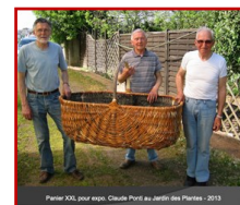
Panier XXL pour expo. Claude Ponti au Jardin des Plantes - 2013